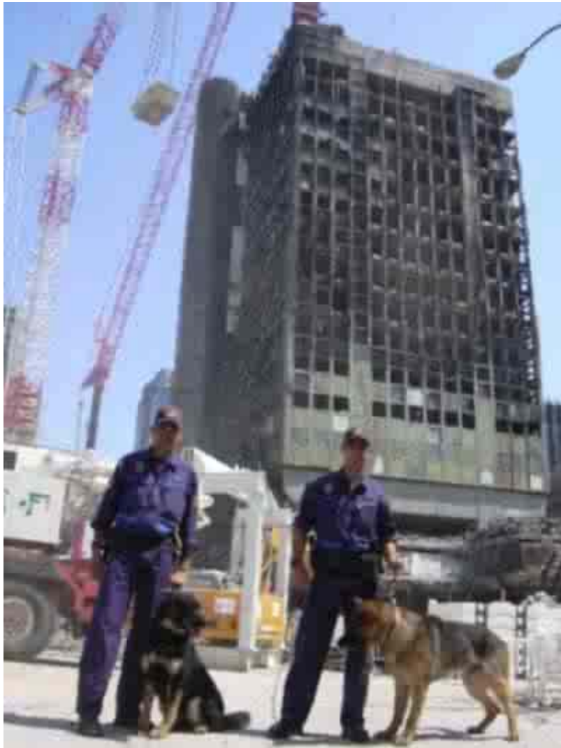
Edificio Windsor (Madrid, 23 de Febrero de 2005)