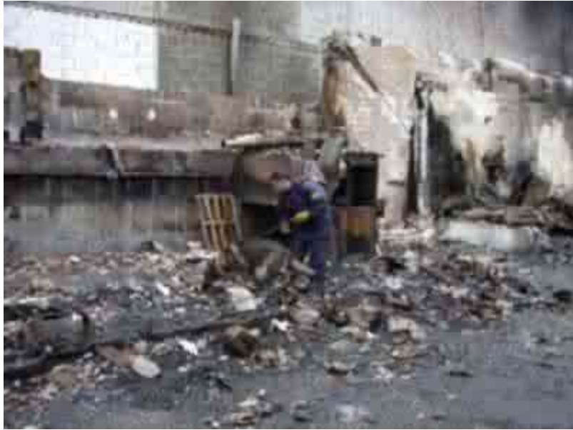
Empresas Sergas (Pontevedra, 25 de Mayo de 2004)

Nuestros compañeros de cuatro patas, se sienten orgullosos de nosotros y, a la vez, siente un poquito de envidia sana, ya que encuentran nuestro trabajo apasionante y muy interesante, pero nosotros le decimos que su trabajo es tan importante y más peligroso que el nuestro, detectar bombas, drogas o personas sepultadas requiere ser grandes profesionales y asumir mucha responsabilidad.